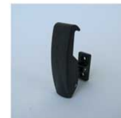
gancio chiusura robusto