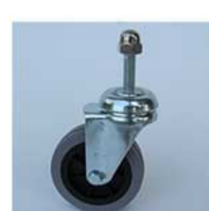
ruota scorrevole antitraccia Ø 80 mm