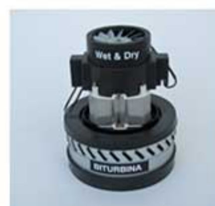
motore bistadio 1300 w max